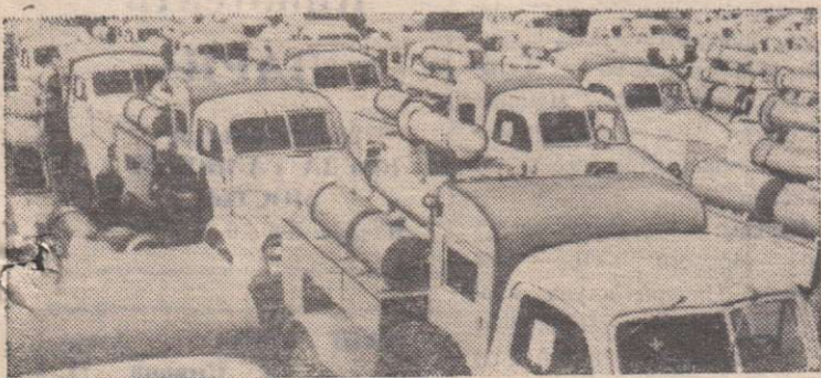
ОМСКАЯ ОБЛАСТЬ. Калачинский механический завод выпускает дезинфекционные установки ДУК-1 для обработки животноводческих помещений и выпасов.

В 1970 году было изготовлено 1 800 таких установок.